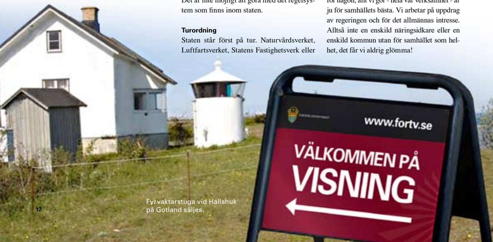
Fyrvaktarstuga vid Hallshuk på Gotland säljes.