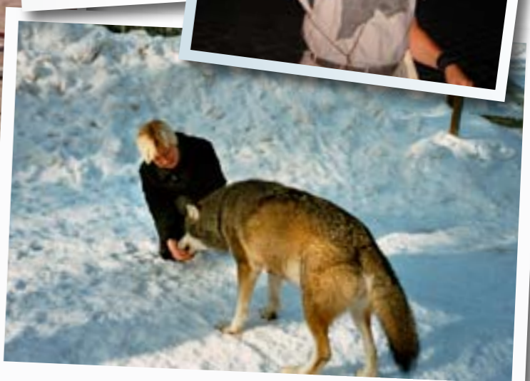
Mys med varg...

Text: Eva Hetting